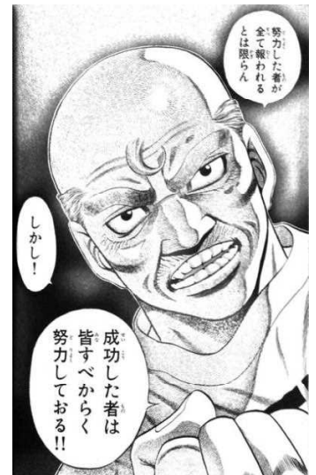
「はじめの一步」鴨川ジム会長

夜の8時頃夜空を見上げると、天頂(真上の空)あたりにひときわ明るく輝く星があります。これは木星で、しし座という星座の近くに見えます。小さな望遠鏡でも、目立つ縞模様を見ることができます。もう少し時間がたつと、東の空に土星や火星も見えるようになってきます。星空を見上げてみませんか。